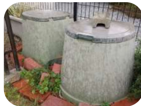
生ごみを自家処理