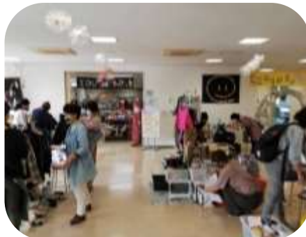
“みんなでフリマ”に出店